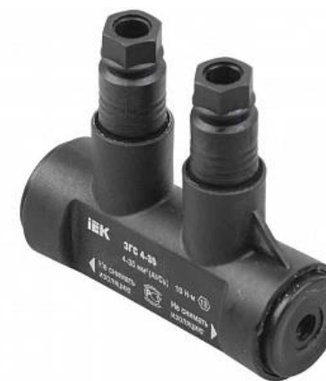
Рисунок 2 Герметичный изолированный зажим ЗГС 4-35

Убирает рабочее место, собирает инструмент, приспособления, такелаж, защитные средства и грузит в автомобиль.